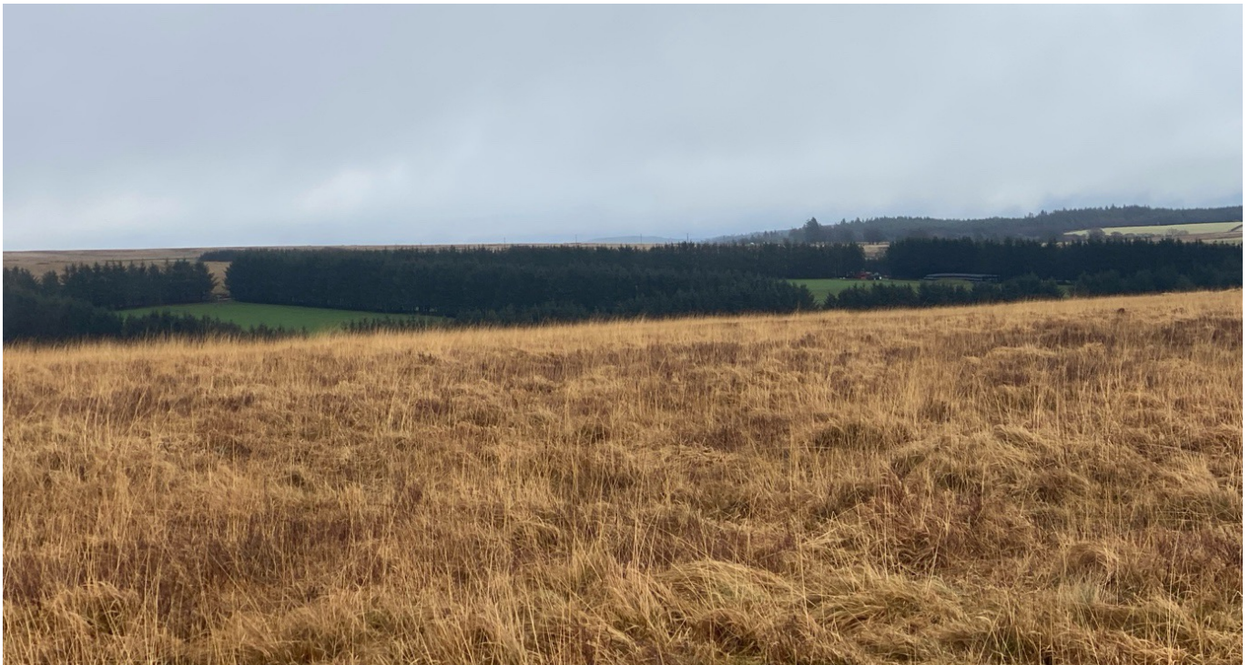
Ffigur 1: Tirwedd fferm fynydd Ardal Lai Ffafirol yn dangos gwrthygyferbyniad rhwng pori ar fryniau agored ac ardaloedd cysgodol, sy'n cael eu rheoli'n fwy cynhyrchiol.

Mae'r llun isod yn dangos cyd-destun fferm fynydd o un o'r ymweliadau safle, gan dynnu sylw at ddefnyddio lleiniau cysgodi: