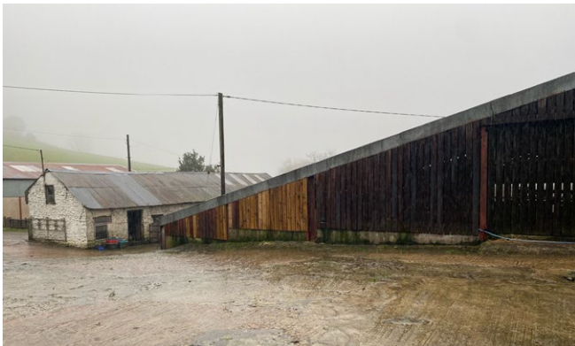
Ffigur 3: Seilwaith fferm yn defnyddio pren a gynhyrchwyd ar fferm.