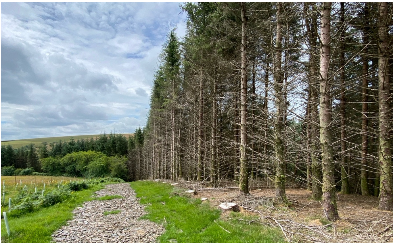
Ffigur 3: Ar fferm 1 yn y Canolbarth, yn dangos planhigion aeddfed o Gronfa Her Rhedyndir ym 1997 ar y dde, coed llydandail brodorol cymysg newydd eu plannu ar ochr chwith y trac, a ffynidwydd Douglas mwy aeddfed ar waelod y trac.

Yn ogystal â'r themâu sy'n deillio o strwythur yr holiadur a'r cyfweliad, daeth pwnc marchnadoedd carbon a'r Cod Carbon Coetiroedd i'r amlwg yn organig yn ystod cyfweliadau ac ymatebion. Trafodir y rhain lle bo hynny'n berthnasol yn y canfyddiadau a'r drafodaeth.