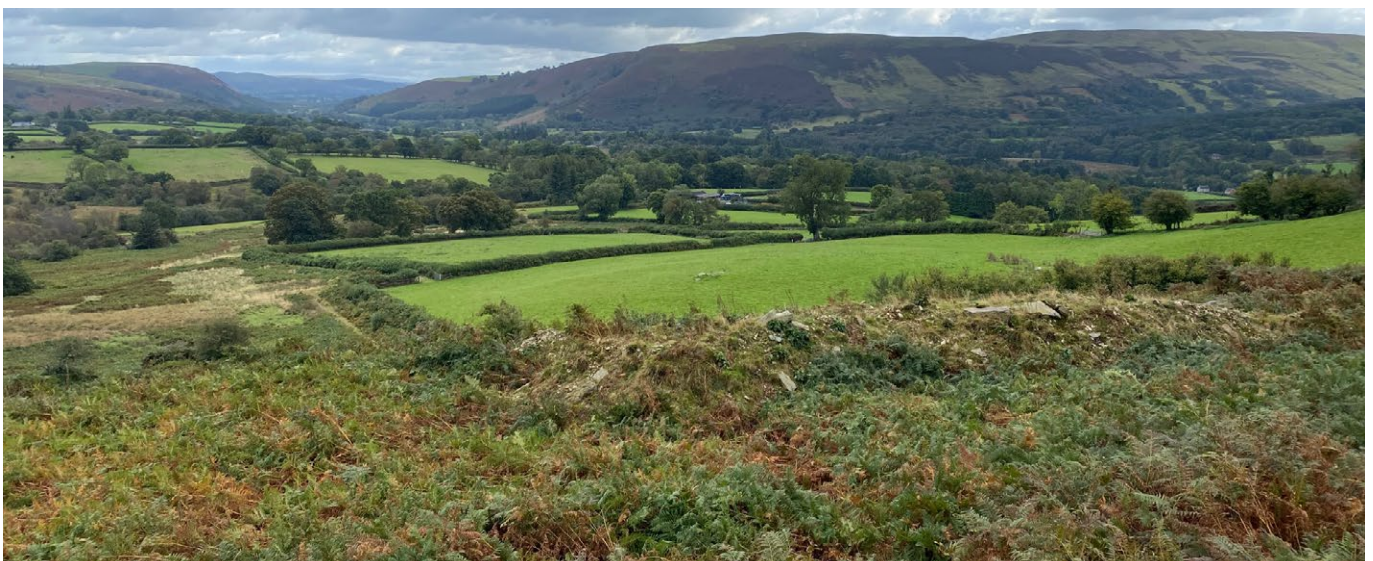
Ffigur 5: Tirwedd yng nghanolbarth Cymru, sy'n dangos rhedyndir, tir pori, bryniau agored, gwrychoedd a choetiroedd.

Dywedodd 6 o'r 16 cyngorydd y byddai ffermwyr cyfagos, a fyddai'n aml yn wrthwynebol neu'n ddeifiol i ddechrau, yn dod yn chwilfrydig am greu coetiroedd, yn enwedig ar ôl iddynt ddechrau gweld y manteision economaidd.